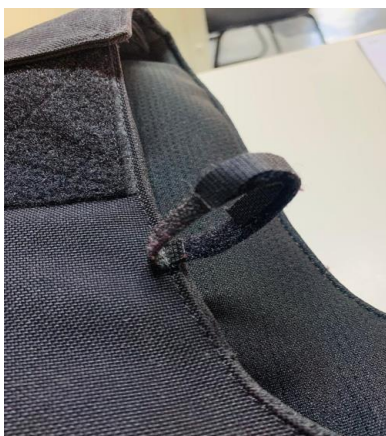
Figura 6 - Tira Abaixo do Degolo

3.6.3.5. Capa frontal, na face externa, na parte superior distando aproximadamente de 7 cm do degolo, deverá ser aplicado 2 tiras de 8cm de largura por 10mm cada uma, sendo uma com o sistema de ganchos e argolas (macho) e a outra com o sistema de ganchos e argolas (fêmea) na lateral da capa.