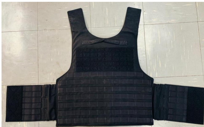
Figura 9 – Capa Dorsal Aberta

3.6.4.6. Capa dorsal, na face externa, na parte superior abaixo da alça de resgate deverá ser aplicado 5 tiras de 25 mm do sistema de ganchos e argolas (fêmea) para fixação das identificações do operador e da Instituição e logo abaixo 7 tiras, ambos acompanhados do sistema M.O.L.L.E.