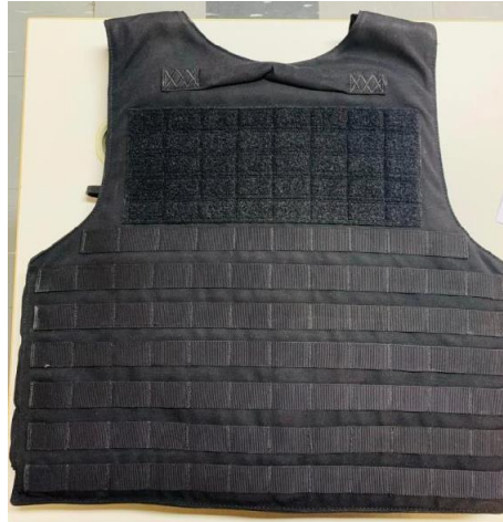
Figura 4 - Capa Dorsal

Avenida General Ataliba Leonel, n.º 556. CEP 02033-000 –Santana – SP. FONE/FAX: (0xx11) 3206-4872/FAX 3206-4877 34