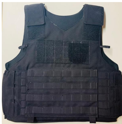
Figura 7 - Capa Frontal

3.6.3.6. Capa frontal, deverá possuir em toda extensão externa horizontalmente tirantes de poliamida com 25 mm de largura, com espaçamento entre si de 25mm, fixados através de costuras eletrônicas modelo travete, sergidas verticalmente a cada 38mm.