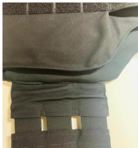
Figura 8 - Elástico embutido na aba lateral

3.6.4.3. Capa dorsal com abas laterais, com 19 centímetros de altura, prolongamento da capa dorsal com costuras de ligação, partindo em direção à parte frontal, distando a aba 3 (três) centímetros da borda lateral inferior da base da capa; com sistema de elástico embutido com limitador de curso em tecido plano de aproximadamente 8 cm, sendo 3 elásticos duplos, com aproximadamente 6 cm por 5 cm de altura, em cada lado garantindo maior firmeza em situações de resgate, boa durabilidade do conjunto e ajuste ao movimento do corpo. Em suas extremidades externas deverão possuir 6 tiras modulares no padrão M.O.L.L.E. com comprimento variando de acordo com o tamanho da capa, o início das fitas se dá a aproximadamente 20mm da costura de união do sistema de elástico com a aba lateral da capa. Nas extremidades das abas nas faces internas, deverá conter sistema de ganchos e argolas (macho) e nas abas faces externas sistema de ganchos e argolas (fêmea), com aproximadamente 90mm de largura.