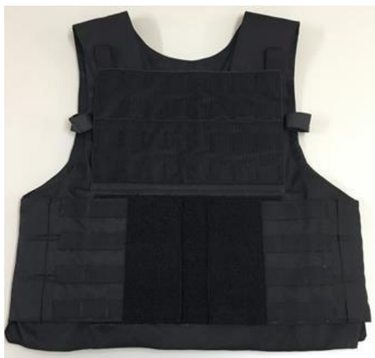
Figura 5 - Capa Frontal com a tampa aberta (conjunto)

3.6.3.3. Possuir na parte inferior da face externa uma aba tendo seu ponto de fixação na parte de cima (tampa), com aproximadamente 20 cm de altura e 30 cm de largura, esta aba deve possuir no lado interno sistema de velcro ganchos (macho) em toda sua extensão, deve possuir abaixo da aba espaço igual no sistema de velcro argolas (fêmea) este abertura será utilizada para acessar os ajuste das faixas laterais fixadas na capa dorsal, proporcionando a mudança de posição para o perfeito ajuste da capa, a face externa da aba deverá acompanhar o sistema M.O.L.L.E em toda sua extensão conforme subitem "3.6.1";