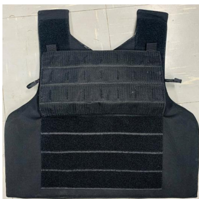
Figura 11 – Capa Frontal Tampa Aberta