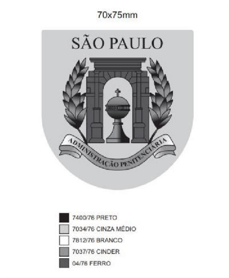
Figura 12 – Brasão

4.1.2. Deve ser produzida na medida aproximada de 70 mm de largura e altura proporcional, conforme figura abaixo: