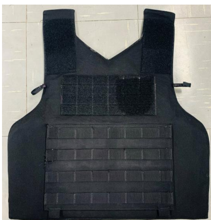
Figura 10 – Capa Frontal Tampa Fechada

fixados através de costuras eletrônicas modelo travete, sergidas verticalmente a cada 38mm.